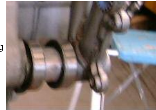
Lagerinnenring rechts beim einpassen

EMILSCHWARZ Präzisionsteile für Motorräder