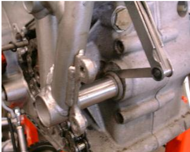
Lagerinnenring links beim einpassender Länge