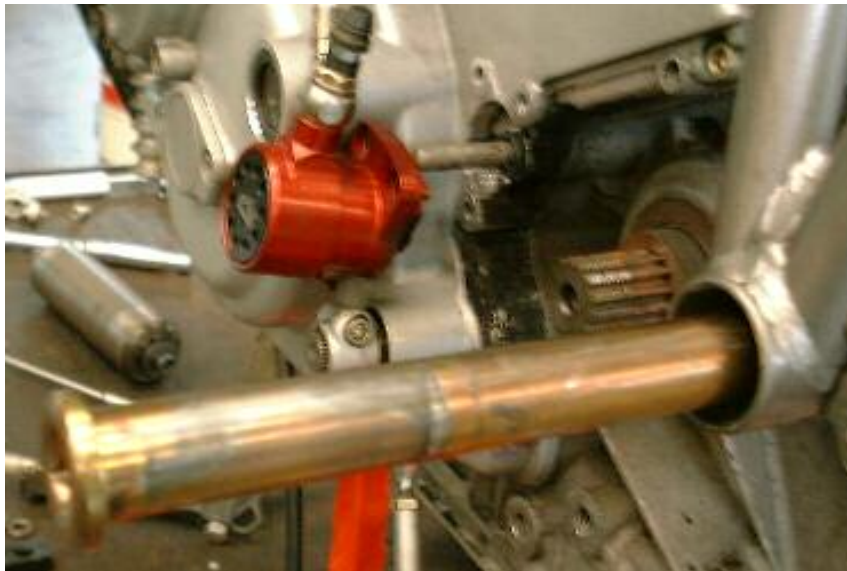
Einlaufspuren an der Schwingenachse (16500km)